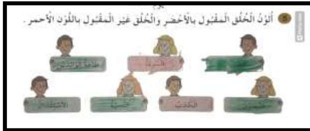
الصورة رقم _03_